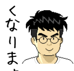
↑似顔絵イラスト メーカーで作成

ポイントその2、「とにかく乾かす」。まる一日、小型の扇風機に当てて乾燥。さらに、乾燥剤といっしょにジップロックに入れて数日。恐る恐る電源を入れます。ちゃんと電源が入りました。まだ少し水が入っていましたが、さらに数日乾燥させて、完全復活です。(^^)v