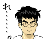
↑似顔絵イラスト メーカーで作成

れ……。アイデア次第でなんでも作れます。まだまだ値段が高くて、教室に入れられませんが、数年以内に値段も下がって、普及してくるはず。そうすると、ますますパソコンでの作品づくりが楽しくなりそう。